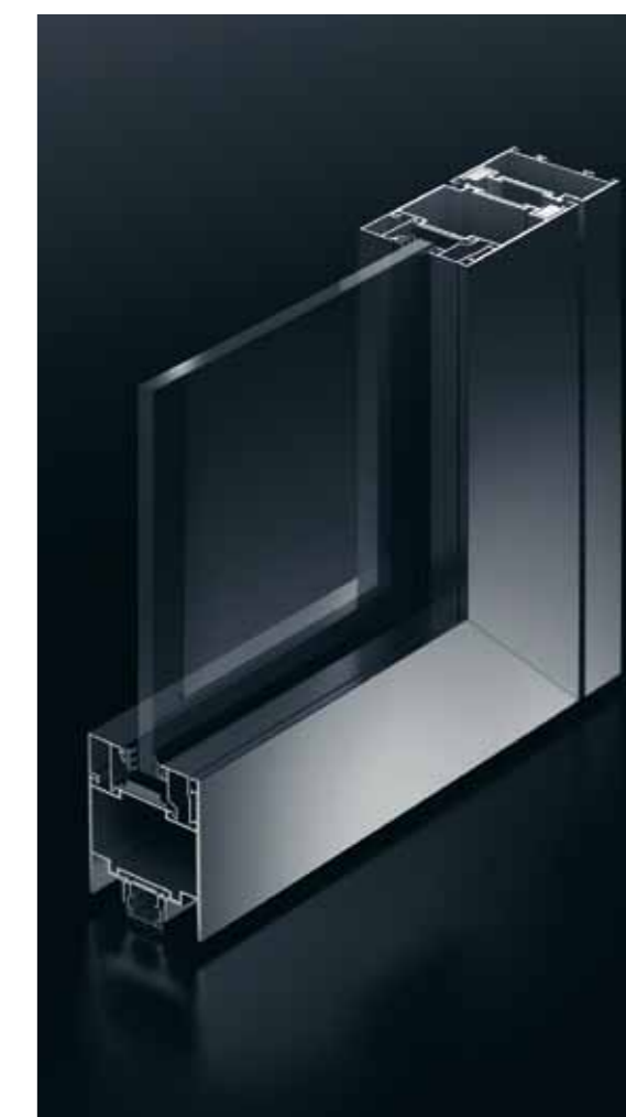
Porte Schüco ADS 65.NI FR 30