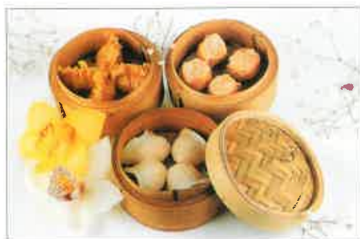
Dim Sam à la vapeur