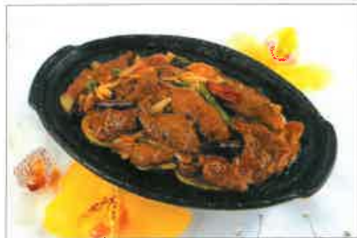
91. Boeuf grillé à la sauce saté sur plaque chauffante