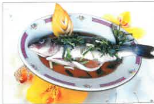
Poisson à la vapeur sauce du Chef