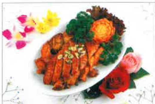
70. Canard laqué