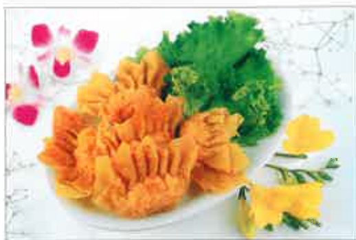
33. Raviolis frits aux crevettes