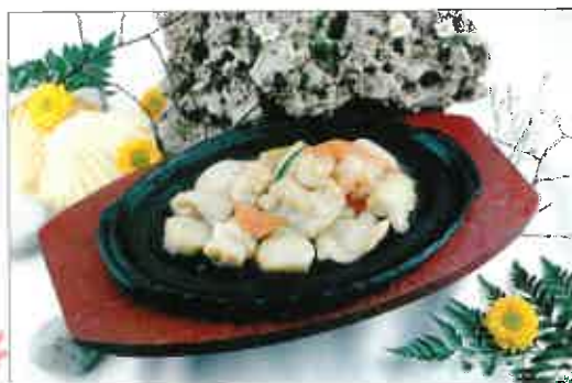
S10. Fruits de mer au basilic sur plaque chauffante