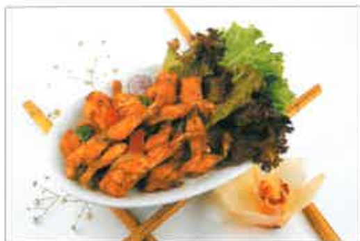
69A. Cuisses de grenouille au sel et poivre