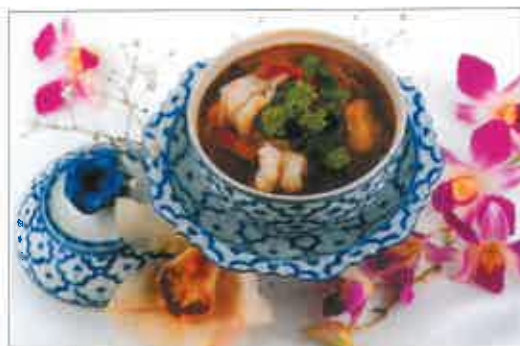
10. Soupe aux crevettes à la citronnelle