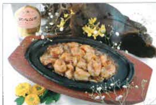
S36. Crevettes flambées au cognac ou alcool de riz sur plaque chauffante