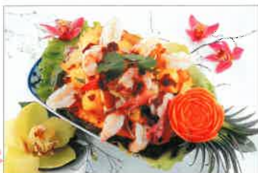
22. Salade aux crevettes et à l'ananas frais