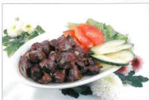
86. Boeuf LOC LAC