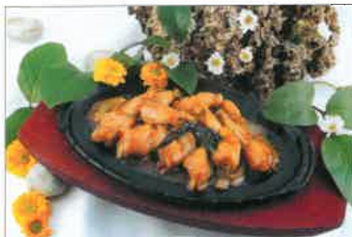
67. Cuisses de grenouille au basilic sur plaque chauffante