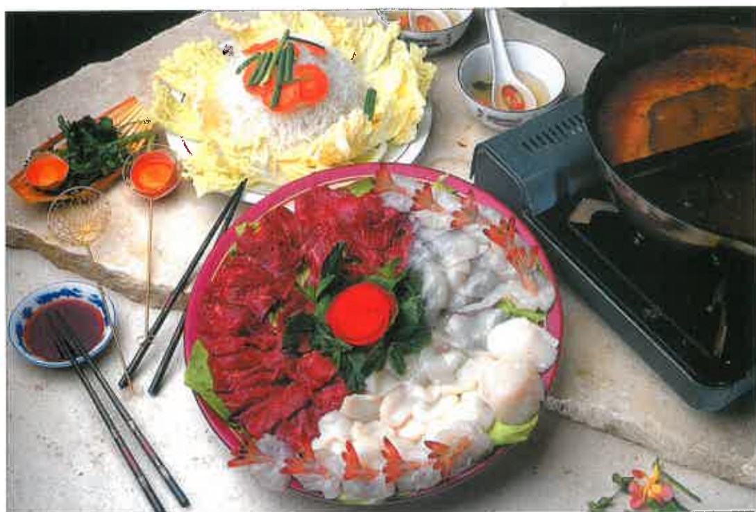
S29. Fondue chinoise (pour 2 personnes)