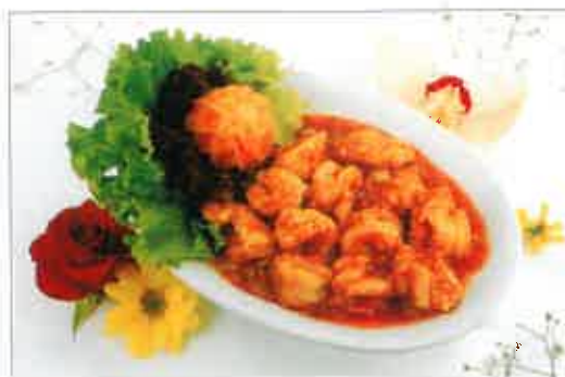
45. Crevettes sauce impériale