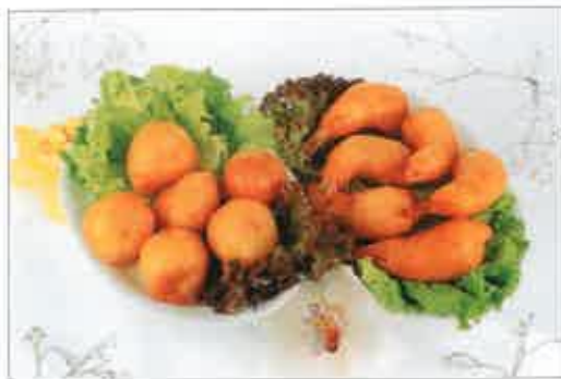
40. Beignets aux crevettes 49. Beignets de Coquilles St-Jacques