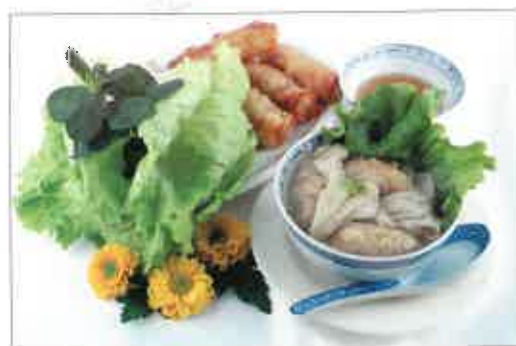
16. Nêms 06. Soupe de raviolis chinois aux crevettes