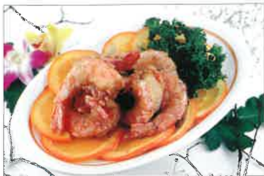
S08. Crevettes grillées au sel et poivre