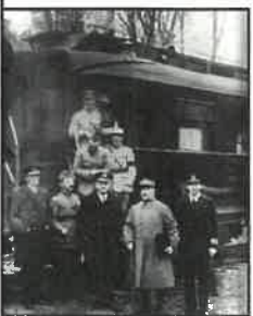
à la sortie du « wagon de l'Armistice » du train d'État-Major du maréchal Ferdinand Foch ...

Pour le centenaire de l'Armistice, avec l'aide des Anciens Combattants du Blanc, le château accueille et présente pendant 2 mois des objets et souvenirs spécifiques à cette guerre.