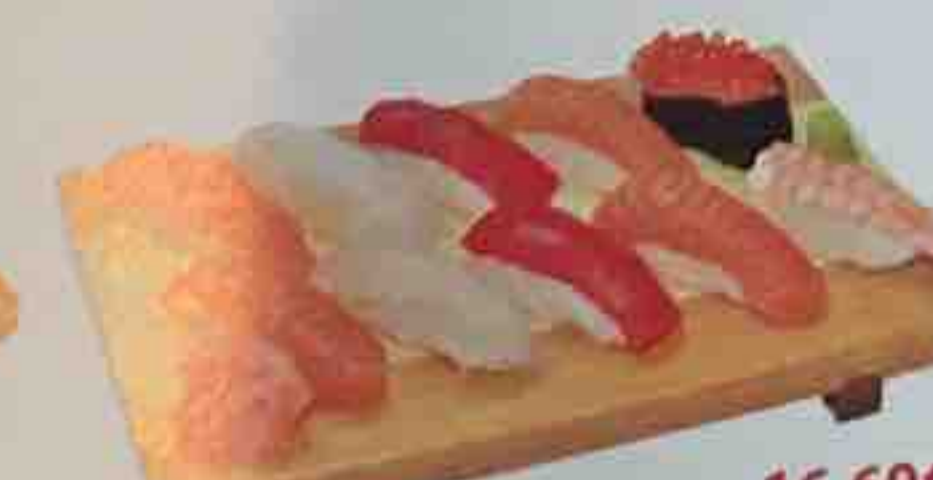
O. Soupe, Salade 16,60€ 10 Sushi (4 saumon, 2 thon, 2 daurade, 1 crevette, 1 oeuf de saumon)