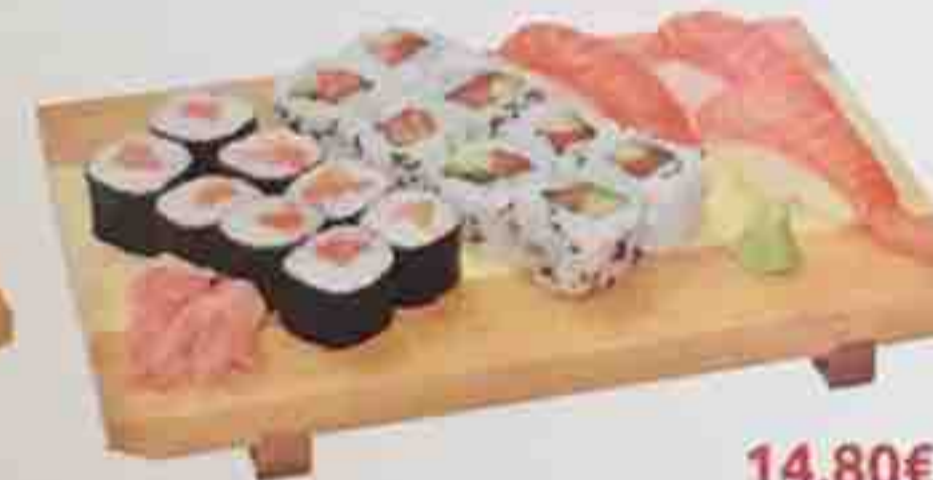
A6. 3 Sushi (saumon), 8 Maki (saumon) 14,80€ 8 California Maki (saumon avocat) Soupe, Salade