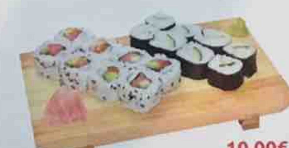
B6. Soupe, Salade 10,00€ 8 California maki, 8 Maki (concombre)