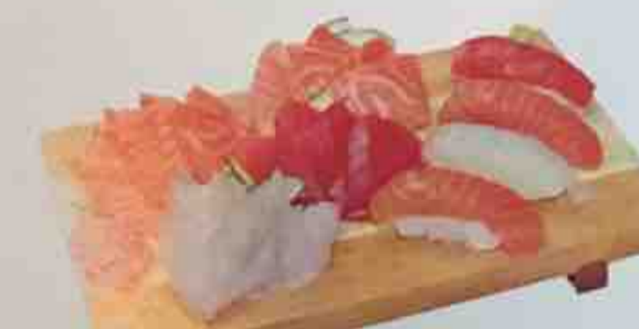
S. Soupe, Salade, Riz nature 19,80€ 16 Sashimi (saumon, thon, daurade, bar) 4 Sushi