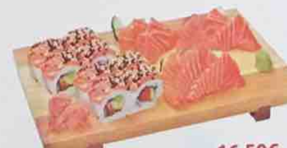
D6. Soupe, Salade, Riz nature 16,50€ 9 Sashimi saumon 8 Maki royal (saumon avocat)