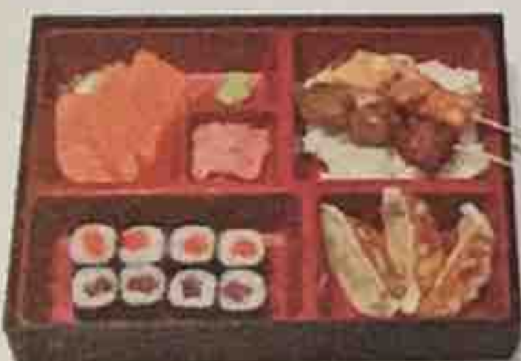
D3. Soupe, Salade, Riz nature 16,80€ 3 Raviolis, 3 Sashimi saumon, 8 Maki (4 saumon, 4 thon) 2 Brochettes (poulet, boulette de poulet)