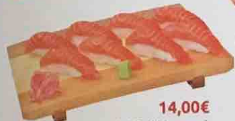
A1. 8 Sushi (saumon) 14,00€ Soupe, Salade