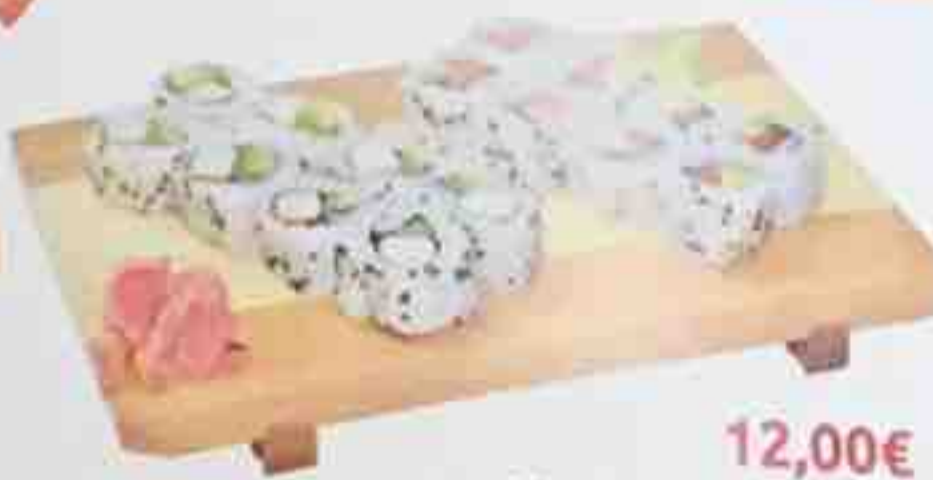
A2. 16 California Maki 12,00€ (8 surimi avocat, 8 saumon avocat) Soupe, Salade