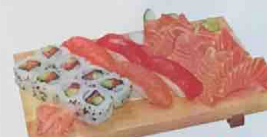
K1. Soupe, Salade, Riz nature 19,50€ 4 Sushi (2 saumon, 2 thon) 8 California maki, 9 Sashimi (saumon)