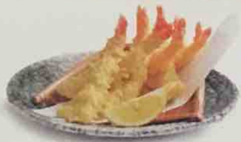
M5. Soupe, Salade, Riz nature 14,50€ 10 Beignets de crevettes