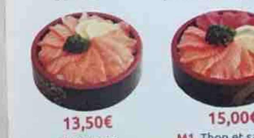
M. Saumon 13,50€ Tranche de saumon crus

(servis sur un grand bol de riz vinaigré)