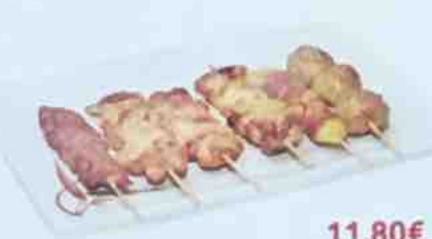
E. 6 Brochettes: (2 poulet, 1 aile de poulet, 1 boeuf, 1 boeuf au fromage, 1 boulette de poulet)