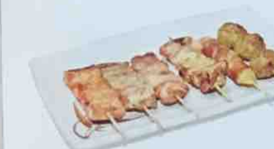
K4. 6 Brochettes: (1 boeuf au fromage, 1 saumon, 1 thon, 1 poulet, 1 aile de poulet, 1 boulette de poulet)