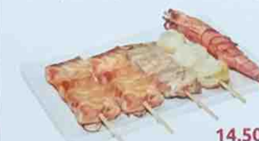
E1. 5 Brochettes: (2 saumon, 1 thon, 1 gambas, 1 coquilles st-jacques)