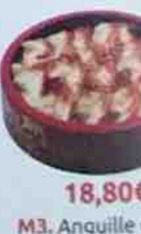
M3. Anguille grillée 18,80€ Anguille grillée