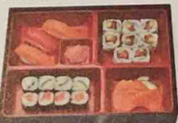
B4. Soupe, Salade 16,80€ 3 Sashimi (saumon), 8 Maki, 3 Sushi (thon, saumon) 8 California maki