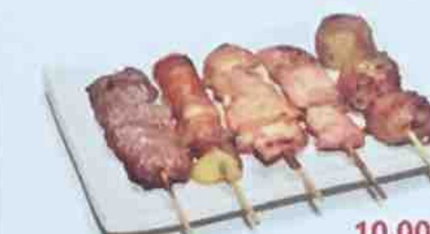
D. 5 Brochettes: (1 poulet, 1 boulette de poulet, 1 boeuf, 1 aile de poulet, 1 boeuf au fromage)