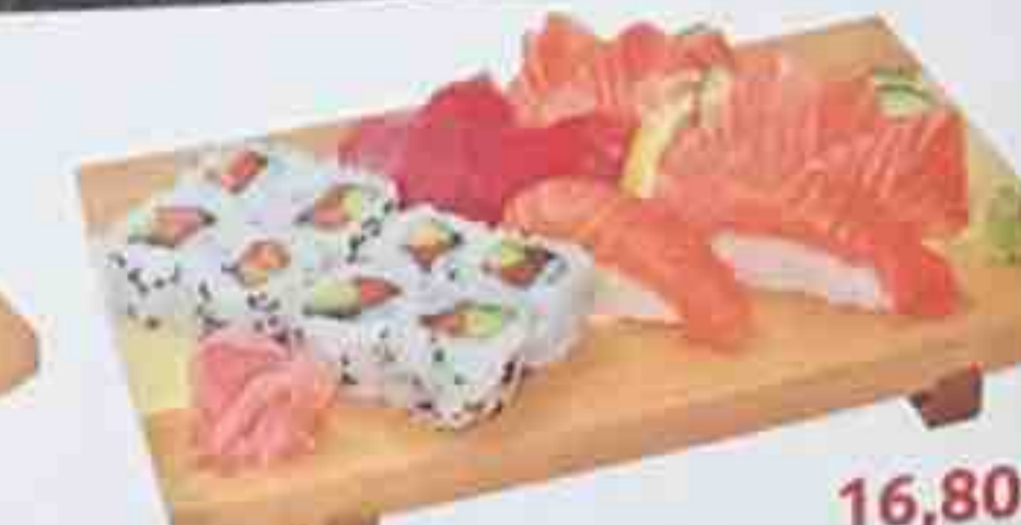
B2. Soupe, Salade, Riz nature 16,80€ 2 Sushi (saumon), 8 California maki 9 Sashimi (6 saumon, 3 thon)