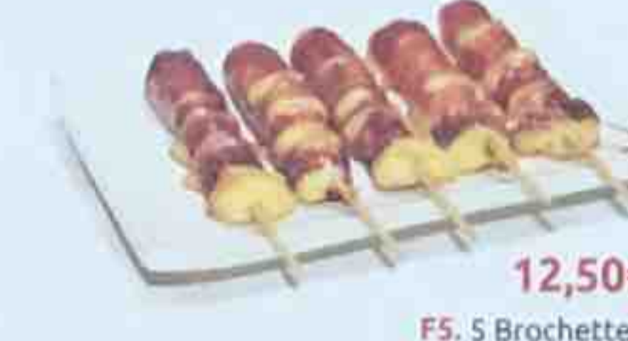
F5. 5 Brochettes: (5 boeuf au fromage)