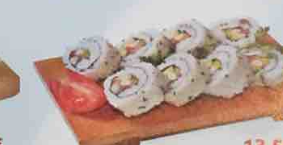
I. Soupe, Salade 13,50€ 8 Futo maki (thon, saumon, concombre, radis, avocat, mayonnaise, surimi)