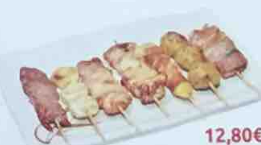
F. 7 Brochettes: (1 poulet, 1 boulette de poulet, 1 aile de poulet, 1 boeuf au fromage, 1 boeuf, 1 canard, 1 champignon)