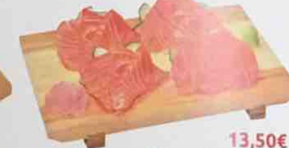
A4. 12 Sashimi (saumon) 13,50€ Soupe, Salade, Riz nature