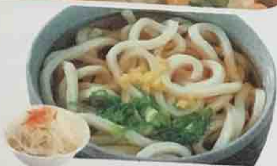
M6. Soupe de nouilles japonaise 9,50€ avec salade