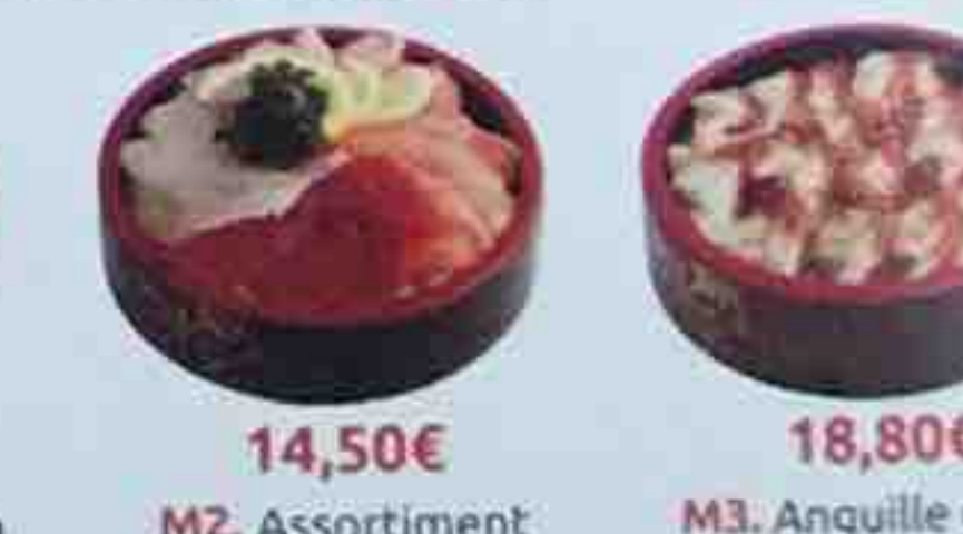
M2. Assortiment 14,50€ Assortiment de poisson crus