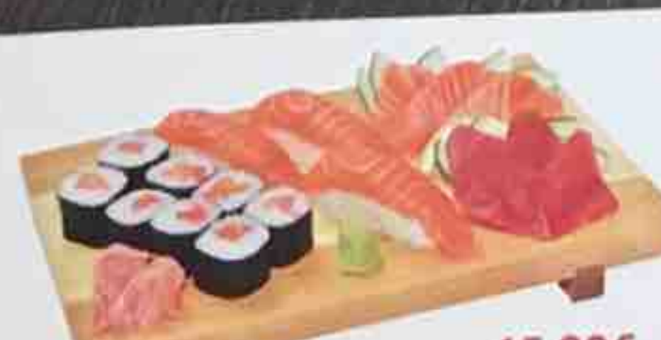
B1. Soupe, Salade, Riz nature 15,80€ 3 Sushi (saumon), 8 Maki (saumon) 6 Sashimi (3 saumon, 3 thon)