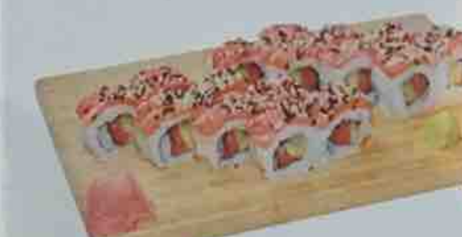
H. Soupe, Salade 16,00€ 16 Maki royal (saumon avocat)