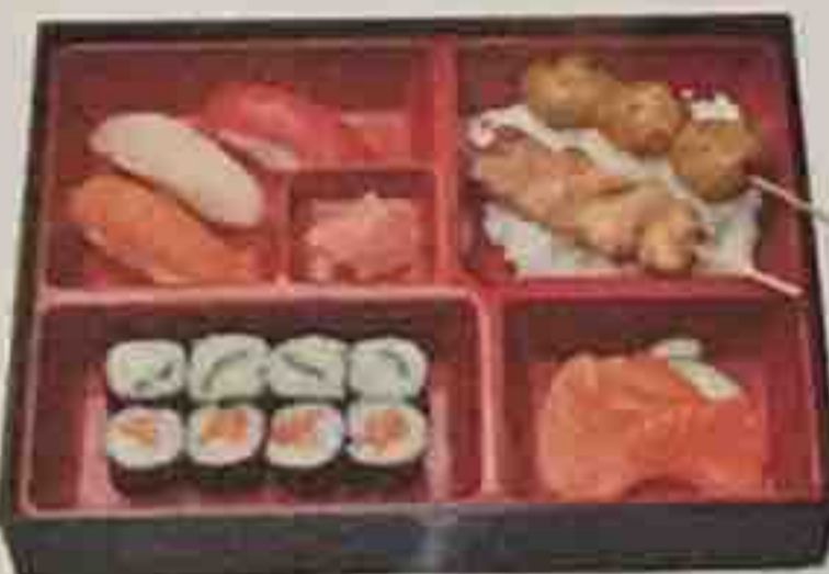
K. Soupe, Salade, Riz nature 16,80€ 3 Sashimi (saumon) 8 Maki, 3 Sushi (thon, saumon, daurade) 2 Brochettes (boulettes de poulet, poulet)