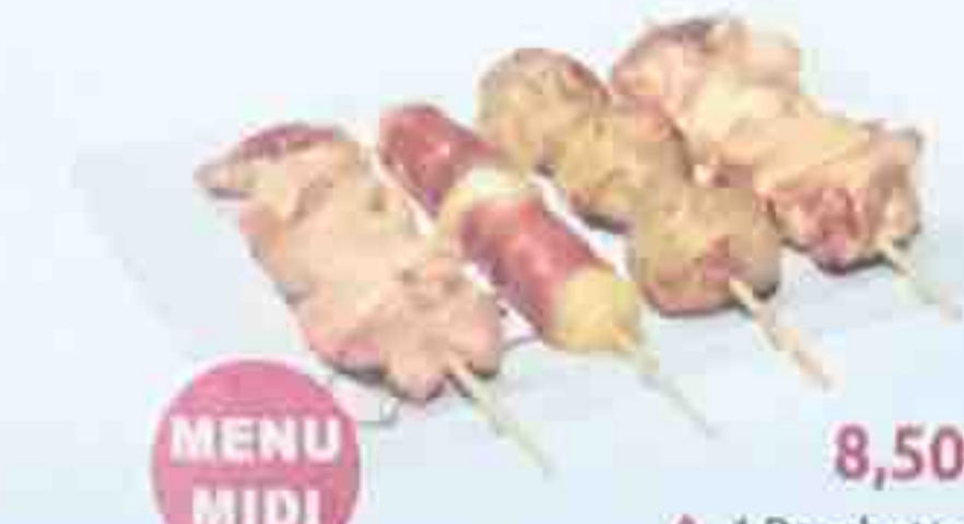
MENU MIDI! 8,50€ A. 4 Brochettes: (1 poulet, 1 boulette de poulet, 1 boeuf au fromage, 1 aile de poulet)