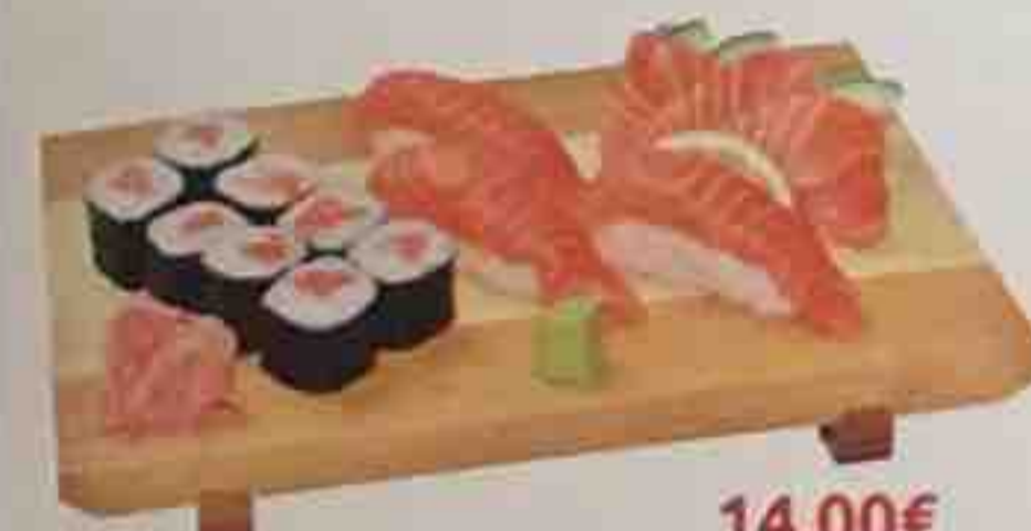
A5. 3 Sushi (saumon) 14,00€ 3 Sashimi (saumon), 8 Maki (saumon) Soupe, Salade, Riz nature