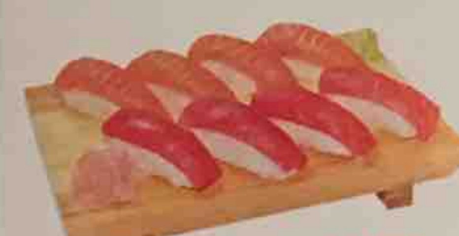
B5. Soupe, Salade 14,50€ 8 Sushi (4 thon, 4 saumon)