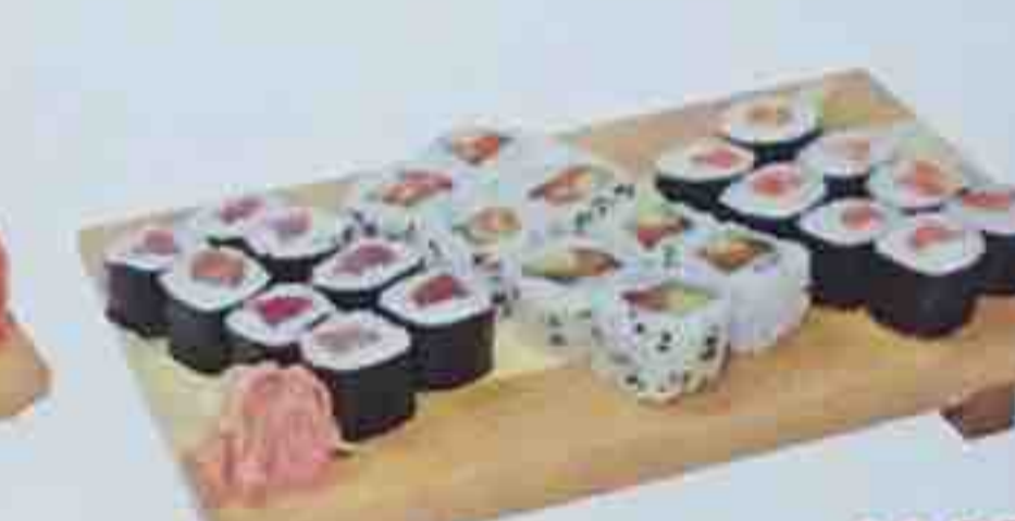
D7. Soupe, Salade 14,00€ 16 Maki (8 saumon, 8 thon) 8 California maki (saumon avocat)