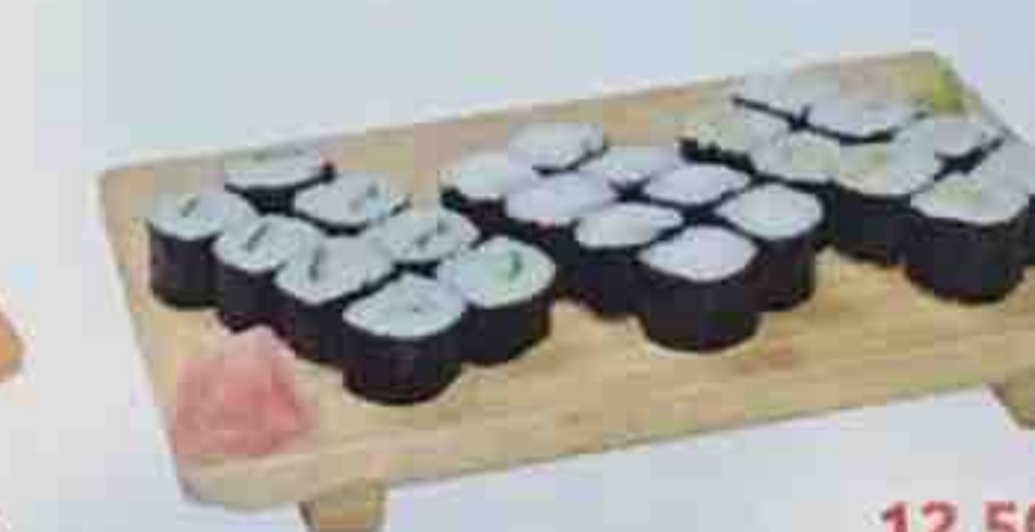
D8. Soupe, Salade 12,50€ 24 Maki (8 fromage, 8 concombre, 8 avocat)