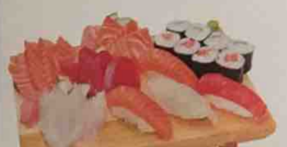
S1. Soupe, Salade, Riz nature 22,80€ 16 Sashimi (saumon, thon, daurade, bar) 4 Sushi, 8 Maki (4 saumon, 4 concombre)