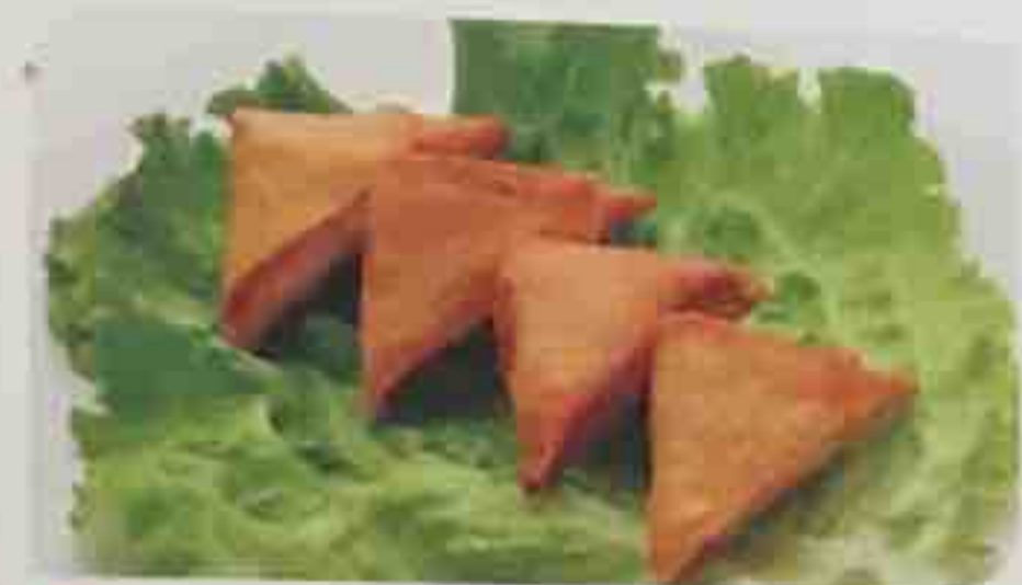
61. Samoussa au boeuf (4 pièces) 5,50€