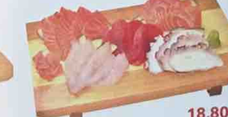
P. Soupe, Salade, Riz nature 18,80€ 20 Sashimis assortis (saumon, thon, daurade, bar, poulet)