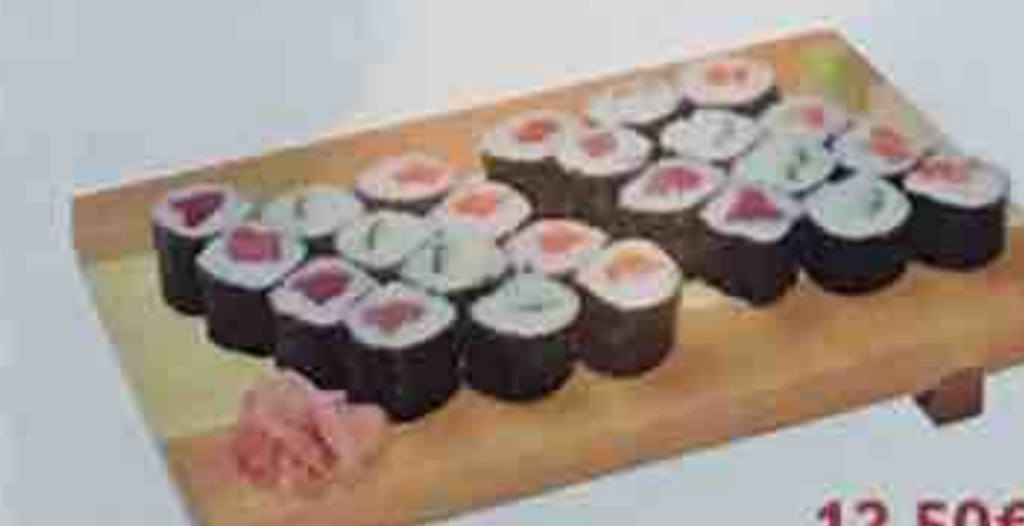
G. Soupe, Salade 12,50€ 24 Maki (8 thon, 8 saumon, 8 concombre)