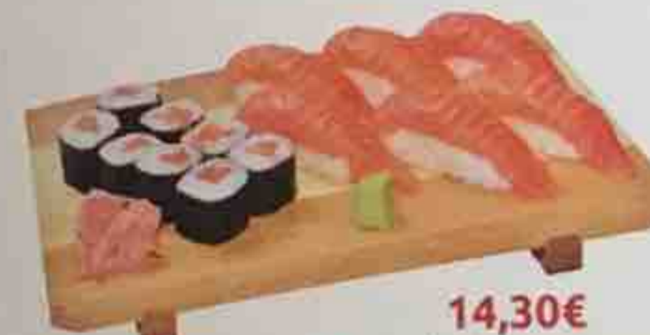
A3. 6 Sushi (saumon) 14,30€ 8 Maki (saumon) Soupe, Salade