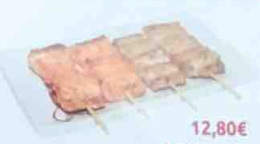
B. 4 Brochettes: (2 saumon, 2 thon)