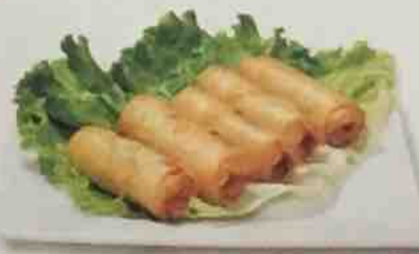
60. Nêms poulets (5 pièces) 5,50€